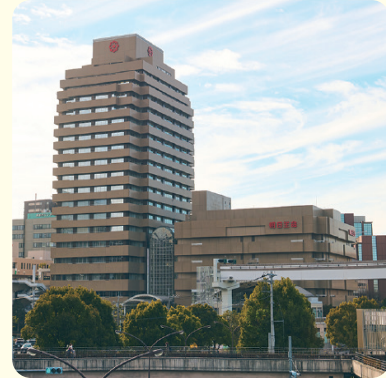
▲本社(多摩センター駅前)

生命保険の会社である「朝日生命グループ」で使うシステムを開発し、安心して使い続けられるように管理しています。生命保険を販売するときに使う営業用パソコンや、お客さまが病気やけがをしたとき、すぐにお金の支払いができるシステムなど、さまざまなIT技術で生命保険の仕事を支えています。お客さまが困らないように、便利で安定したシステムを開発することが、私たちの大切な役割です。